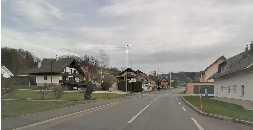
CESTA OD KRIŽIŠČA Z GOSTILANO PR' HALDET DO TRGOVINE